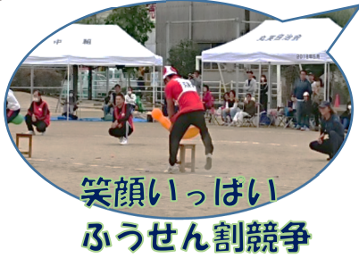
笑顔いっぱい ふうせん割競争

早朝パラパラと雨が降り肌寒い日になりましたが開催中は曇り空となりみなさん元気いっぱい頑張りました!!