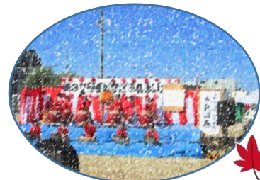
手城小和太鼓クラブ