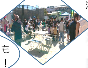
消防車にも乗れたよ♪