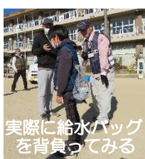
実際に給水バッグを背負ってみる