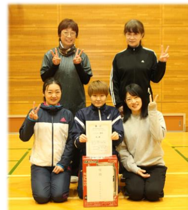
女子の部優勝 浅原チーム