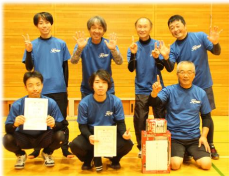
男子の部優勝 金名Bチーム