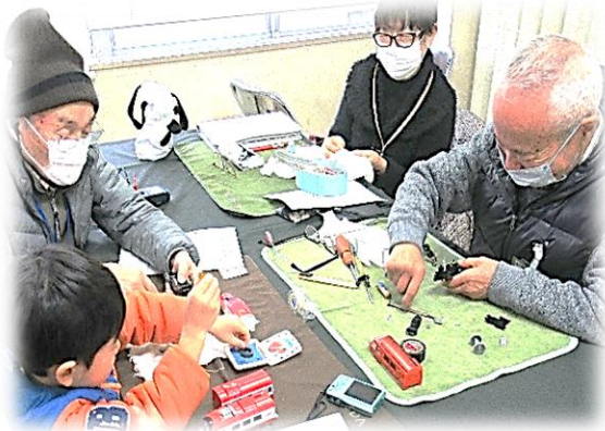
ドクターと一緒に治療に挑戦します！