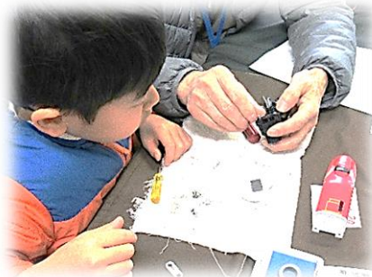
おもちゃが治ったときの 子どもたちの嬉しそうな顔 がとても素敵です！！