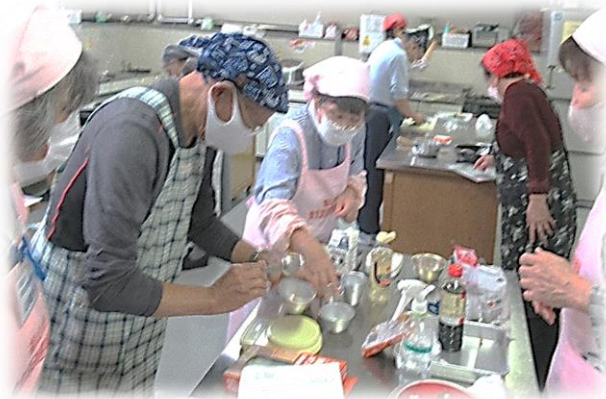
ていえいようよほう りょうりつく ) 【低栄養予防の料理作り】

やく ねん 約3年ぶりにデモンストレーション ではない調理実習を行うことができ ました。みんなが久しぶりに集って いっしょ たの かわ りょうり つく 一緒に楽しく会話しながら料理を作っ たり食べたりできることの喜びを感 じ合うことができました！