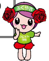
「フレイル予防ローラ」