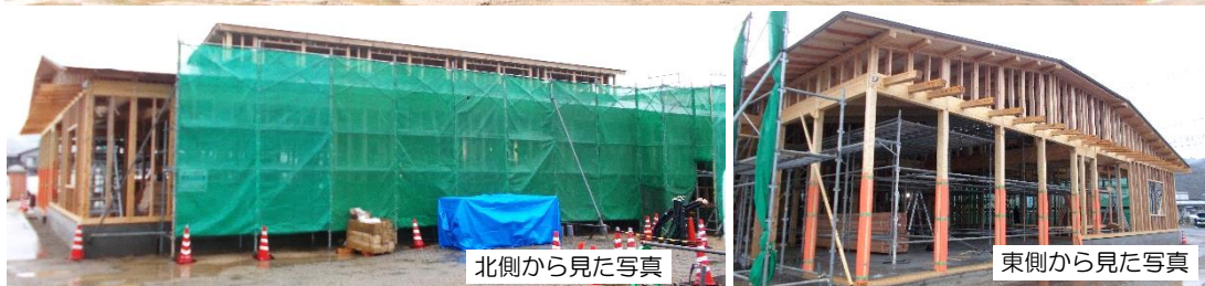
北側から見た写真