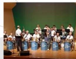
【New Swing Dolphins】