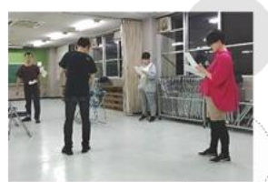
【演劇ユニットそなえ】

【問合せ先】福山市役所まちづくり推進部 まちづくり推進課 TEL(084)928-1243 FAX(084)928-1229