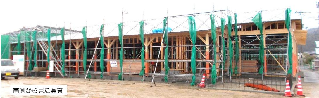
南側から見た写真