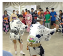
【福山市古典芸能保存会】