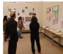
【沼隈郷土文化龍之助研究会】

【問合せ先】 福山市役所まちづくり推進部 まちづくり推進課 TEL(084)928-1243 FAX(084)928-1229