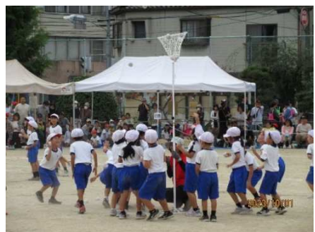
*玉入れ* かわいいダンスもみんな上手でした