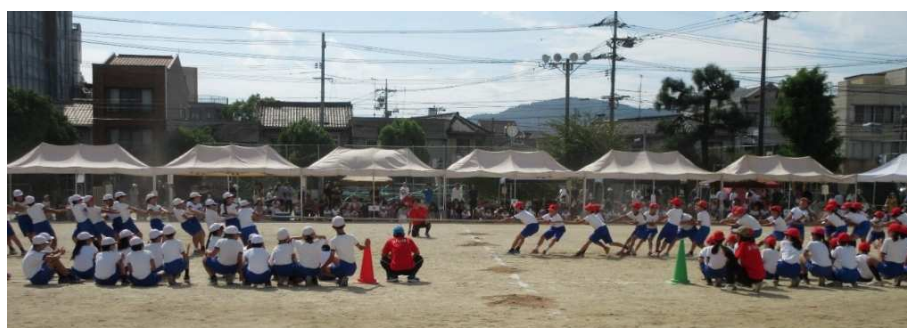
*つなひき* どっちも頑張れー！