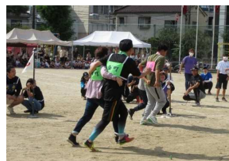
*二人三脚* 息ピッタリ！