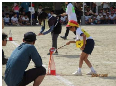
*水入れ継走* 上手に入るかな？

まだ少し暑さの残る10月1日、南小学校で第66回南学区民運動会が行われました。4年ぶりの開催に大勢の参加者で、競技にも応援にも熱が入っていました。優勝は2019年に続き2年連続で霞町！！子どもから大人まで大いに楽しんだ秋の1日でした。