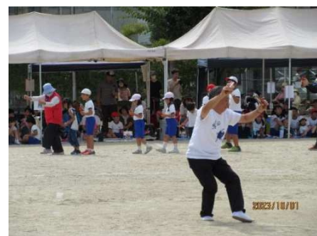
*二上り準備ダンス* 子どもも大人も先生も参加して、大きな輪で踊りを習いました