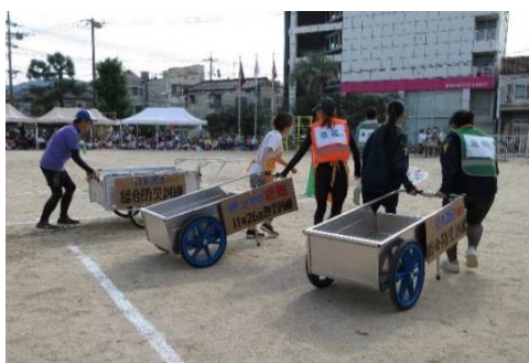
*防災リレー* 土震も負傷者役も上手に運べました