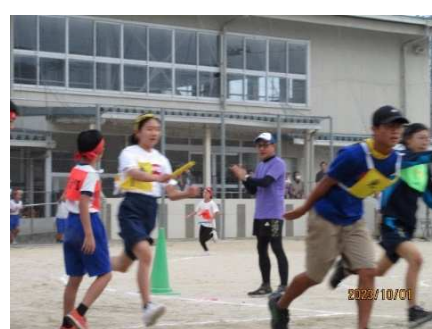
*町別対抗リレー* ハラハラドキドキの熱戦が繰り広げられました