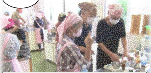
～どうする？災害時の食事～