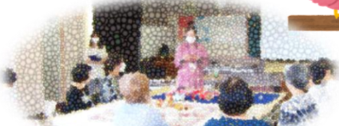
「支援からみえてきたこと」