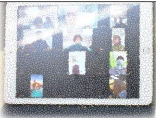
「Zoomでレクリエーション」