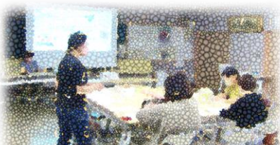
「多文化共生はまちづくり」