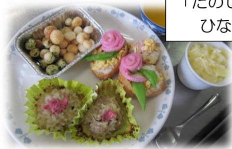
「たのしい ひなまつり」