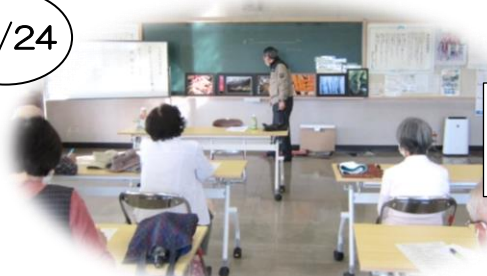
「失敗のない キレイな写真の撮り方」