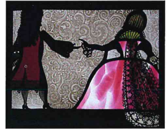
ドビュッシー『小組曲』III. メヌエット