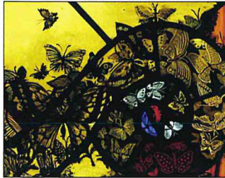
シューマン『カーニバル Op.9』10. 蝶々

山田 耕柝：ピアノのための《からたちの花》 ドビュッシー：2つのアラベスク第1番 マルティヌー：春の庭 ラヴェル：ボレロ