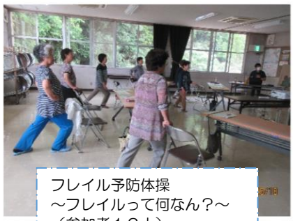
フレイル予防体操 ～フレイルって何なん?～ (参加者12人)