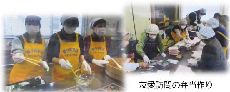
友愛訪問の弁当作り

20数年来同じことの繰り返しのボランティア活動に新しく若い風を吹き込んでください。そのことが「ふれあい・支えあう・安全なまち」住んでよかった野々浜学区になることと信じています。