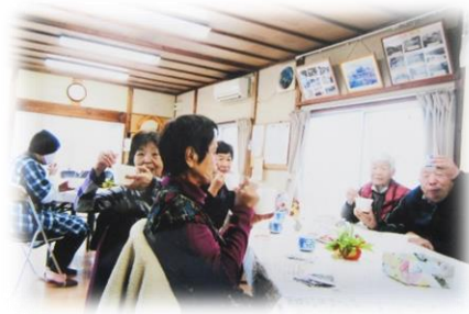
ふれあいいきいきサロン