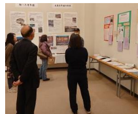
【沼隈郷土文化瀧之助研究会】