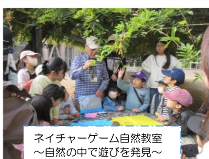
ネイチャーゲーム自然教室 ～自然の中で遊びを発見～ (参加者28人)