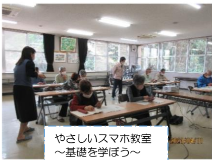
やさしいスマホ教室 ～基礎を学ぼう～ (参加者11人)

子どもたちも含め、一年を通して大勢の方に参加していただきました。来年度も実りある社会教育活動事業を実施しますので、引き続き多くの方の参加をお待ちしています。