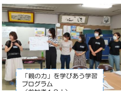
「親の力」を学びあう学習 プログラム (参加者13人)