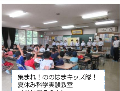
集まれ!ののはまキッズ隊! 夏休み科学実験教室 (参加者56人)