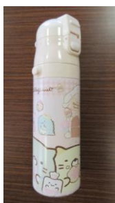
帽子・水筒 交流館の窓口付近にありました