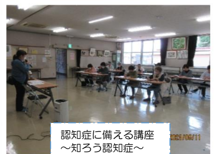
認知症に備える講座 ～知ろう認知症～ (参加者12人)