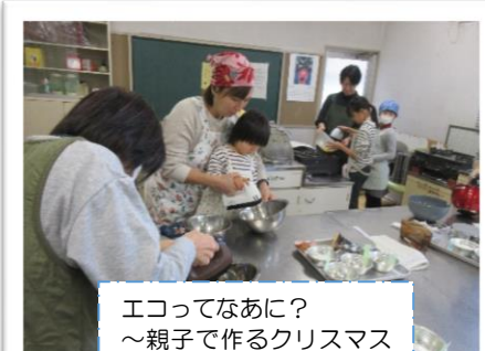
エコってなあに? ～親子で作るクリスマスケーキ～ (参加者9人)