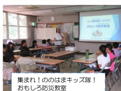
集まれ!ののはまキッズ隊! おもしろ防災教室 (参加者28人)