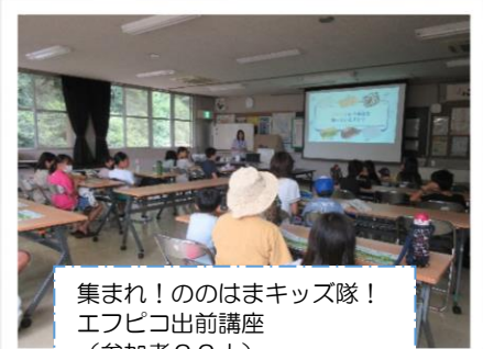
集まれ!ののはまキッズ隊! エフビコ出前講座 (参加者22人)