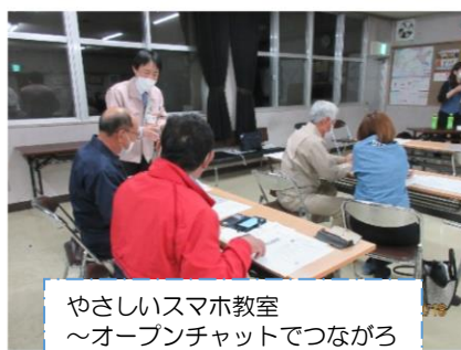
やさしいスマホ教室 ～オープンチャットでつながろう～ (参加者12人)