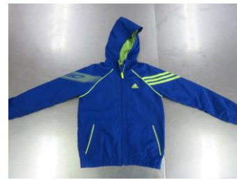
アディダスのブルゾン 坂里公園のベンチにありました

心当たりのある方は、交流館の窓口にある「落とし物・忘れ物BOX」を確認してください