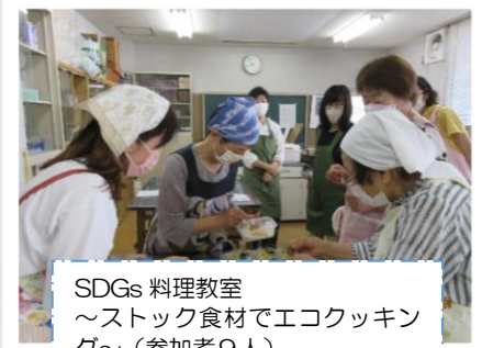
SDGs 料理教室 ～ストック食材でエコクッキング～ (参加者9人)