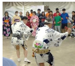
【福山市古典芸能保存会】

【問合せ先】 福山市役所まちづくり推進部 まちづくり推進課 TEL(084)928-1243 FAX(084)928-1229