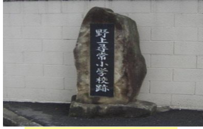
⑮ 野上尋常小学校跡