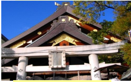
⑭ 出雲大社福山分詞