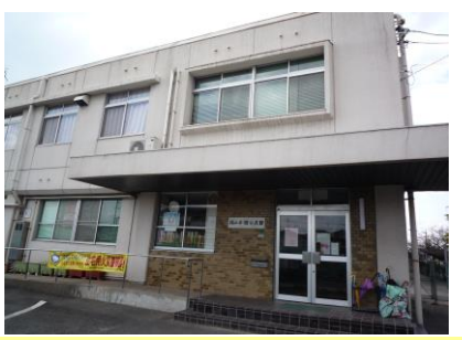
⑥曙交流館 憩いの場所、小学校・幼稚園に隣接しています。