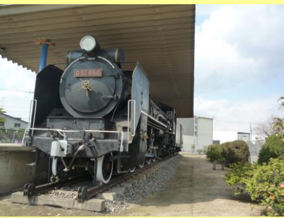
⑤曙公園 D51機関車が展示されています。