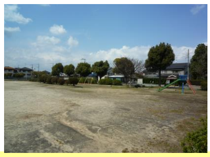
④二の川公園 テニスコート・ゲートボール場があり、朝はラジオ体操もしています。