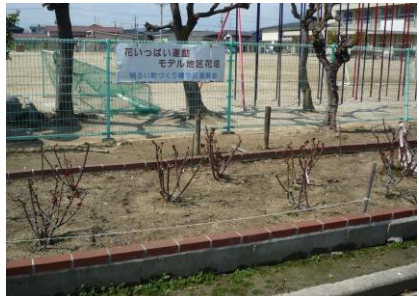
①曙第2公園 住民により守られているばら花壇。