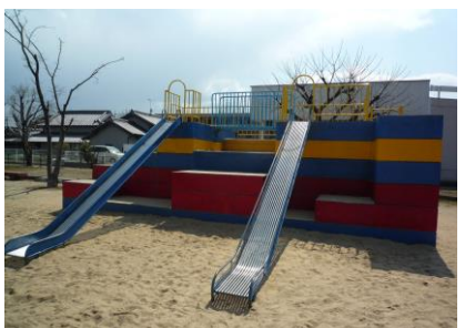
③一の川公園 カラフルな滑り台があります。