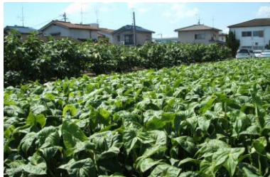
②くわい畑（福山特産・日本一）