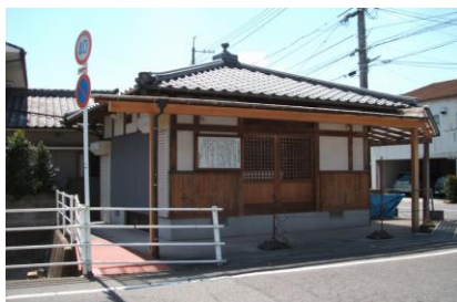
⑤お月さん・石像の本尊 「月山大権現」が祀られています。