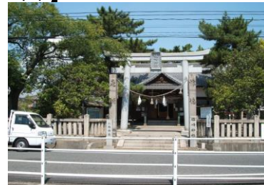
③塩崎神社・八幡神社