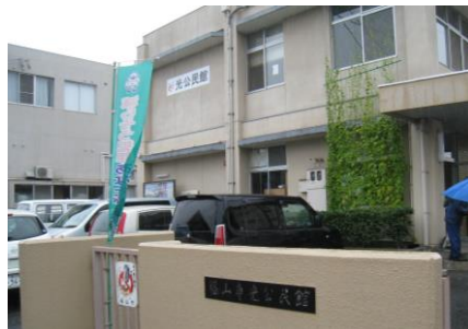
①光交流館 シンボルロードへ出発進行!