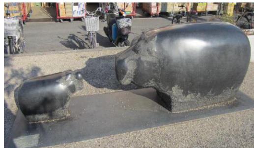
③シンボルロードで 親子カバと一緒に休憩