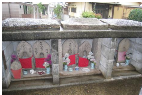
②お地蔵さんにご挨拶です