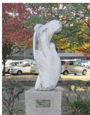
④“バスケットボール”