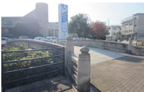
⑥石橋を渡って体育館へ