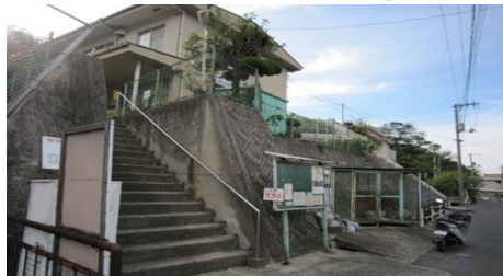
＜走島交流館＞フェリーのり場から徒歩5分。ここからスタート!