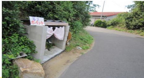
毎月21日お大師さんの日は、お地藏様を地元の方がお参りされます