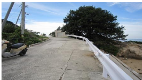
坂道やカーブが多いよ。車に気を付けて!