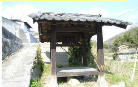
⑤ 休み堂（オ戸） 歩いていると右手に見えてきます