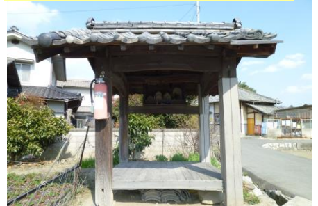
⑥ 休み堂（オ戸） 昔は旅人も休んでいたのかな？