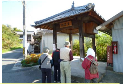
② 地藏堂（坂之東） 平成16年に改修されました