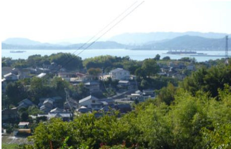
④ がんばって坂をあげると 松永湾が一望できます