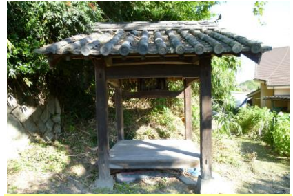
③ 休み堂（オ戸） 近くに大きなイチョウの木があります