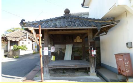
① 休み堂（坂之東） 近所の人々の夕涼み場になっています