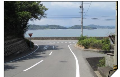
⑥特養（むつみ苑）入口三叉路西側