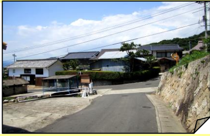
④南ゴミステーション横の 三叉路東側