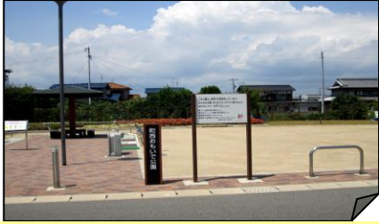
①スタート 町西おもいで公園 ゴール