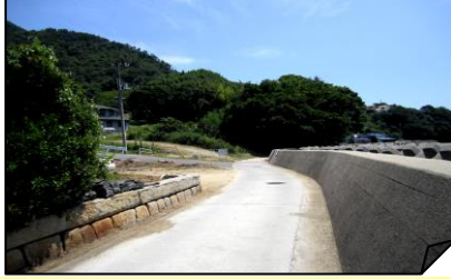
②県道南海岸道路南端の三叉路