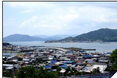
⑤横田漁港を見下ろして一休み