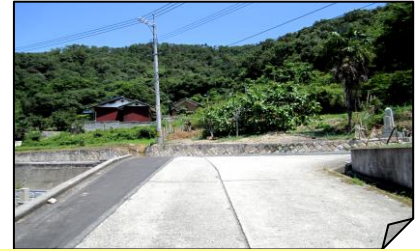
③妙見神社の北側三叉路