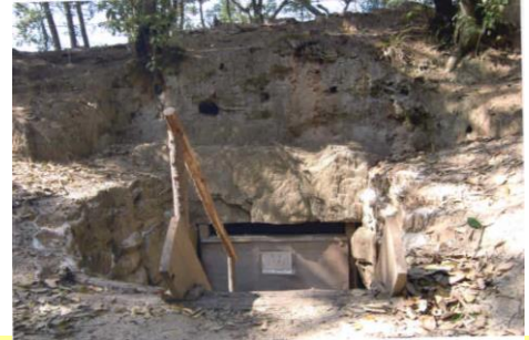
③二子塚古墳 6世紀末頃の前方後円墳。2009年7月に国の史跡となりました。