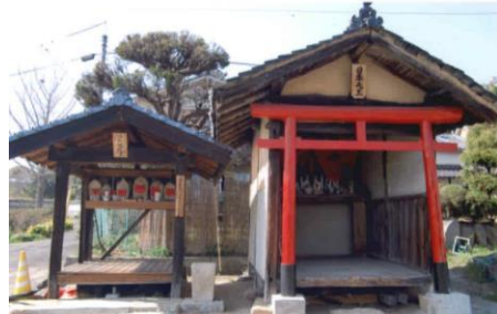
②池ノ内 荒神さん 地藏さん その昔、地元の有力者が五穀豊穡を祈り造られたそうです。