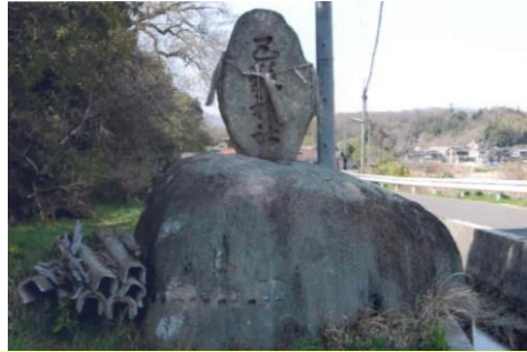
⑤赤子岩 その昔、岩を割ろうとしたら岩の中から赤子の鳴き声をしたそう。