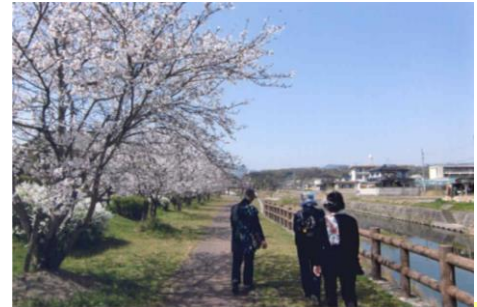
⑥中島公園 服部川のせせらぎ。春は桜。見上げれば蛇円山。ほっと一息。