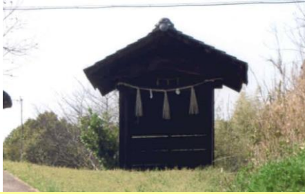
①最明寺跡 コースより少し外れます。小さな祠ですが、立ち寄りてみては？