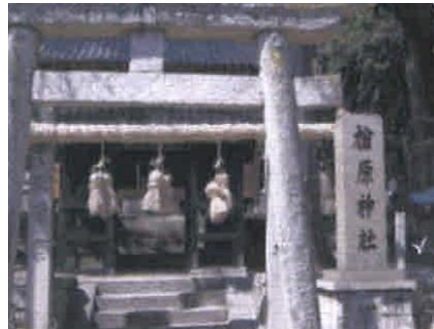
③金名の榎原神社（トイレ有）