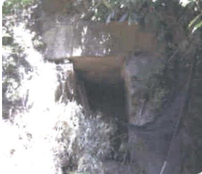
②13基ある権現古墳群の、第1号古墳の横穴式石室