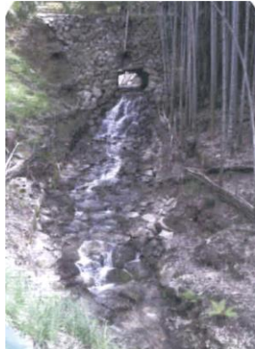
①金名の郷頭 江戸時代に造られた堰と橋の機能を兼ね備えた石造構築物