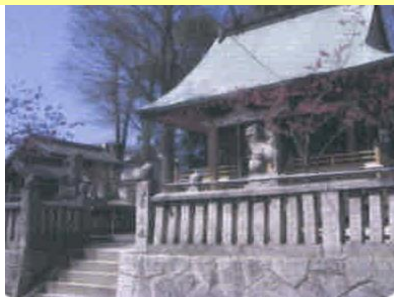
④浅原の品治別神社（トイレ有）