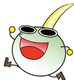
福山市環境イメージキャラクター くわいちゃん