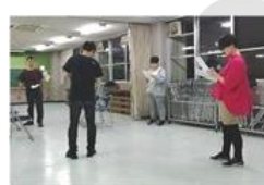
【演劇ユニットそなえ】

【問合せ先】 福山市役所まちづくり推進部 まちづくり推進課 TEL(084)928-1243 FAX(084)928-1229