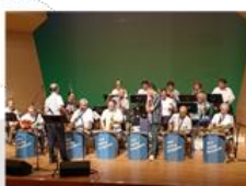
【New Swing Dolphins】