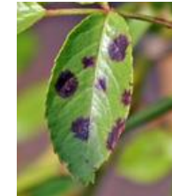
くろほしびょう 黒星病 (黒点病)