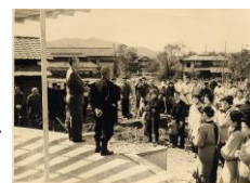
～とうじのしゃしん～

日本がせんそうをしていた1945年(昭和20年)、福山市は空しゅうを受けて、市がい地のやく80%がやけてしまいました。せんそうであれはてたまちを美しくしていこうと、今のばら公園の場所に、まわりに住んでいた人たちが、やく1,000本のばらのなえを植えたことがはじまりです。「ばら」は『福山市のふっこうのシンボル』なのです。