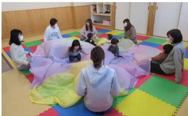
子・育・て・交・流・事・業

運動後は、車座での交流のほか、講師が一人ずつ声掛けして回り、子どもの気になることにアドバイスされていました。