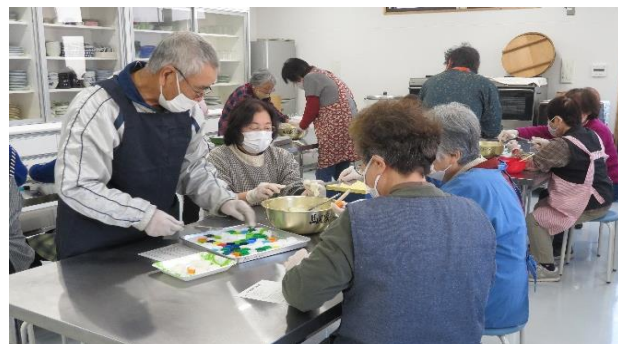
地・域・交・流・事・業

この講座が、2023年度最後の講座になりました。たくさんの方にご参加いただきありがとうございました。2024年度も様々な講座を予定し、みなさまの参加をお待ちしております。