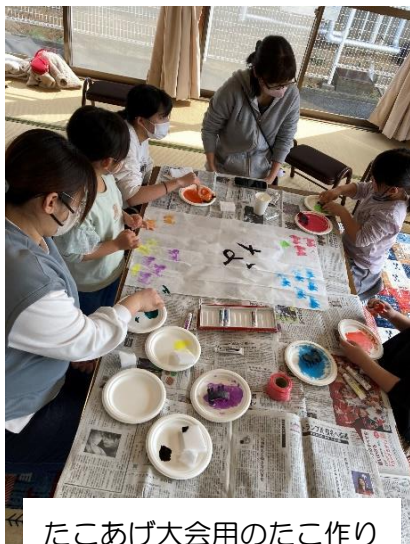
たこあげ大会用のたこ作り