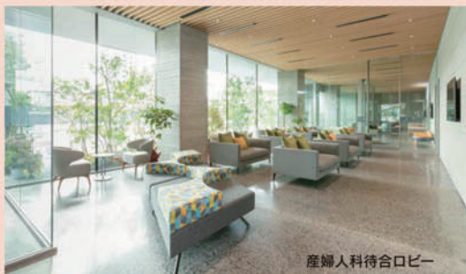
産婦人科待合ロビー