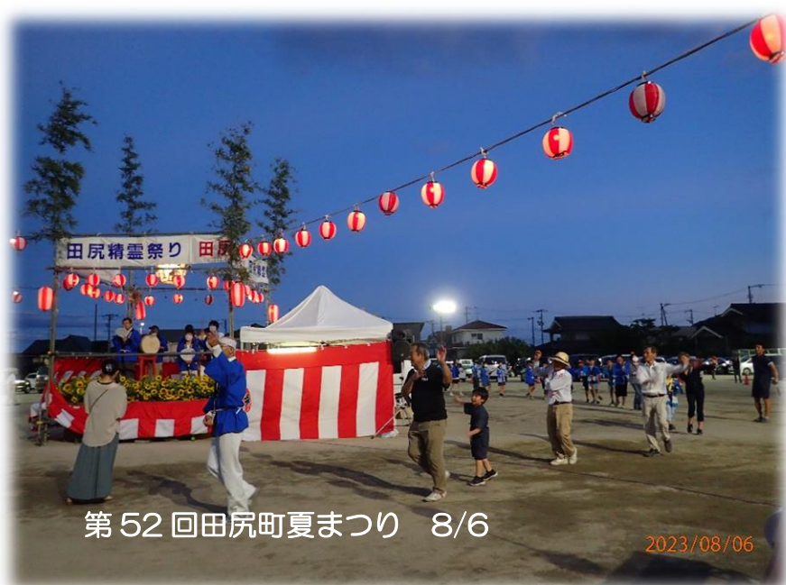
第52回田尻町夏まつり 8/6