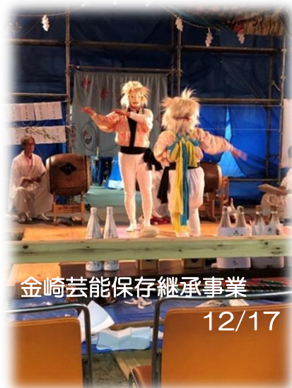
金崎芸能保存継承事業