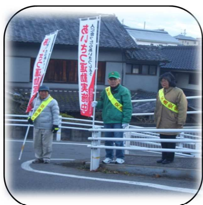
あいさつ運動強化日 毎月15日