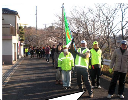
毎週水曜日 向陽町防犯パトロール