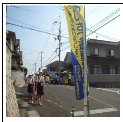
あいさつ運動のぼり旗