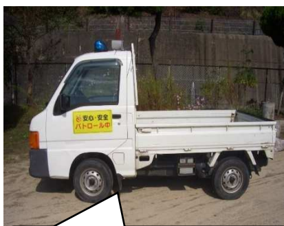
防犯パトロール車