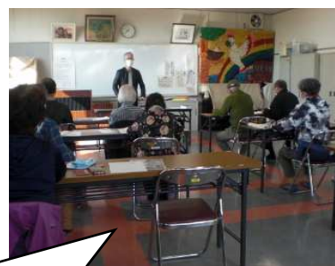
オープンチャットの講習会