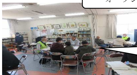
まちづくりミーティング での話し合い