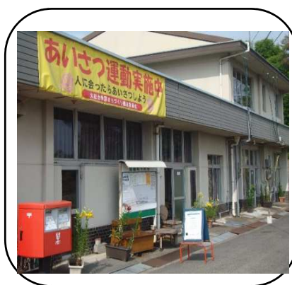
あいさつ運動横断幕