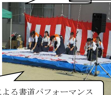
葦陽高校による書道パフォーマンス