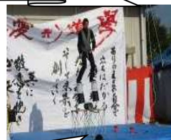
学区出身 大道芸人 S4