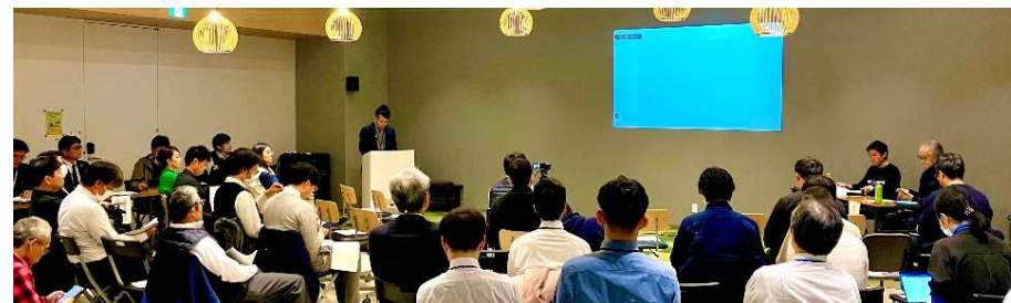
昨年のふくまちエリア価値創造フォーラムの様子