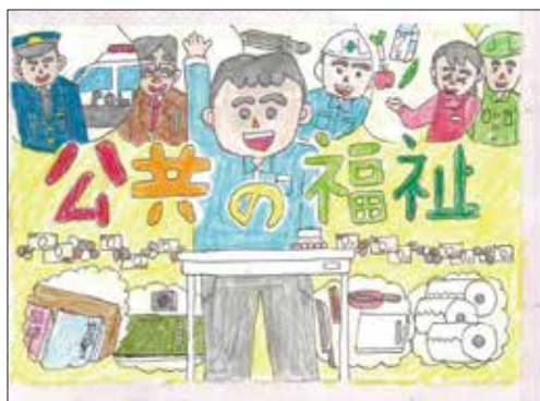
第 23 回「税に関する絵はがきコンクール」 福山市教育委員会教育長賞受賞作品

※事業所用床面積が 900 m 2 超、従業者数が 90 人超の場合は、申告が必要です。