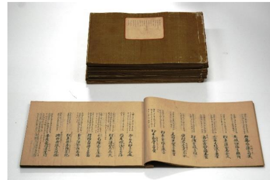
御奏者番心得九冊物