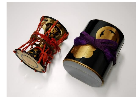
黒漆塗御紋付御鼓 鼓箱付