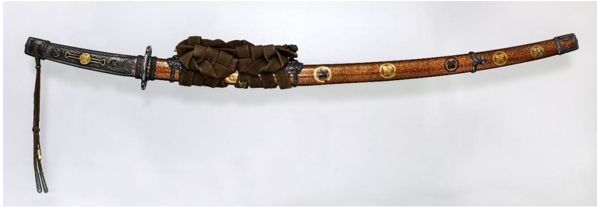
金紋散毛抜形衛府太刀拵脇差付