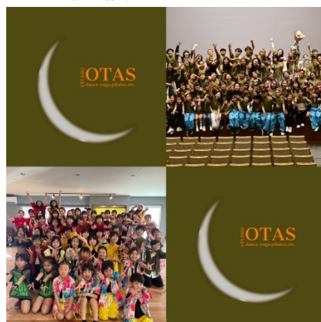
ヒップホップダンス