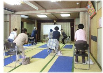
こころ けんこうたいそう からだと心の健康体操