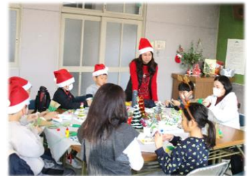
まいご たの 英語とクリスマスを楽しもう!