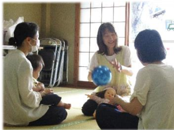
リトミック・ベビー