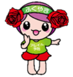
「フレイル予防ローラ」