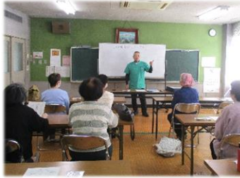
じぶん からだ じぶん まも 自分の体は自分で守る