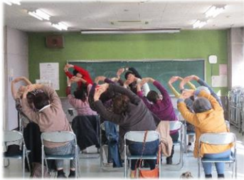
ひろば うたごえ広場