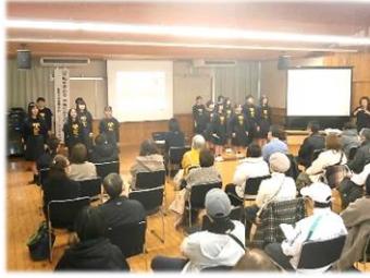
ほんじょう にしこうりゅうかんだうどうじぎょう 本庄コミュニティー・西交流館合同事業