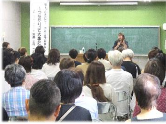
しせつりようしゃがくしゅうかい 施設利用者学習会