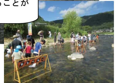
【図2：水辺教室開催時の様子】