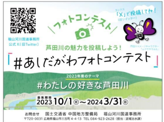
【図4：フォトコンテスト開催案内】

#あしだかわフォトコンテストを10月1日から開催中です。詳細は福山河川国道事務所公式 X(旧 Twitter)を確認してください。