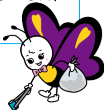
マスコットキャラクター ムラサキちゃん