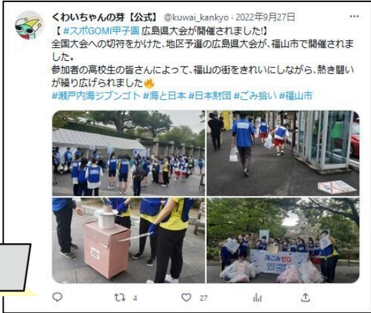
【図 2：ごみ対策の情報発信の例 (福山市環境部 Twitter)】