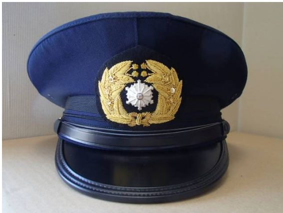
冬制帽(写真は消防司令補の例)