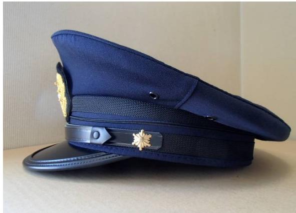
夏制帽(写真は消防司令補の例)