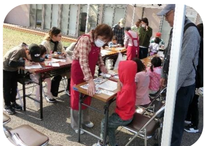
プラ板作り楽しいな！人気でした★