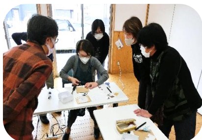
講師の見本を参考に、凛々しい 干支の“午”ができました。