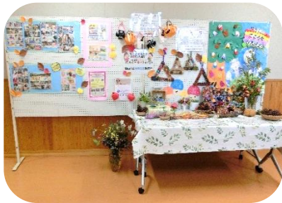
保育所・こども園のこどもたちの様子