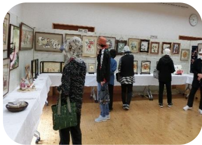
今回も力作ぞろいすごいです！