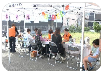
初めてのカラーネイル♡