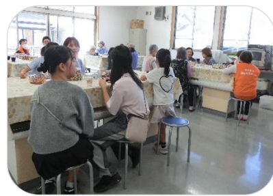
“おいで喫茶” コーヒーがおいしかったよ