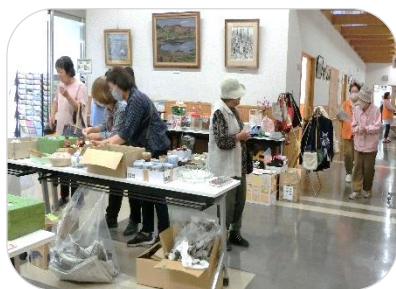
何かおもしろい本があるかな？