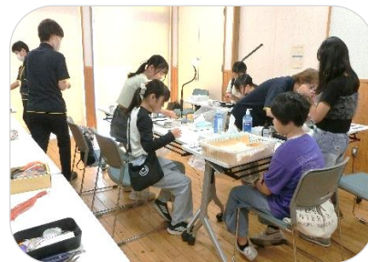
レジンの小物づくり