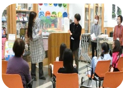
おはなし会の様子