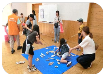
魚釣りは意外とむずかしいなあ

福祉を高める会と水呑交流館図書室ボランティア（虹のかけはし）による『福祉おたのしみ会』が行われ、こどもから高齢者までミニゲームやもの作りなど、楽しい時間を過ごしました。