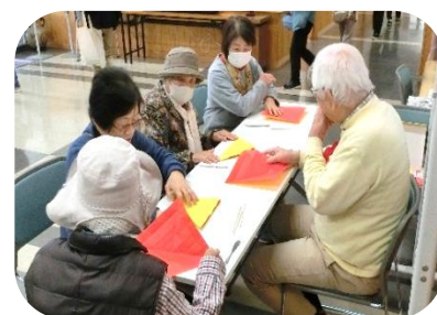
折りばら教室の様子