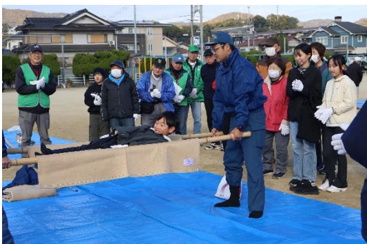
【 負傷者搬送訓練 】