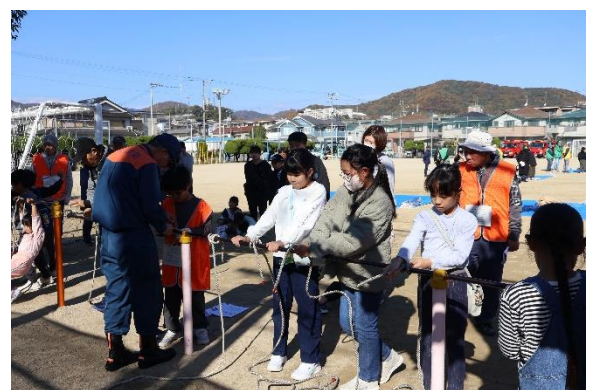
【 ロープの結び方 】