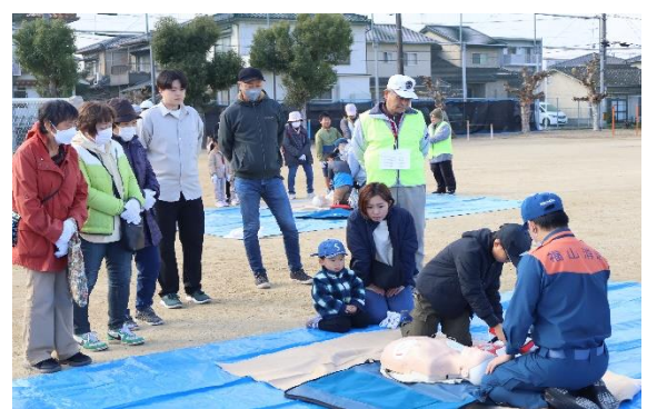
【 AED 操作訓練 】