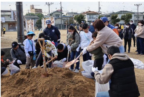
【 水防訓練（土のう作り・土のう積み） 】