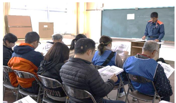
【 避難場所体験訓練（校舎南棟3階まで） 】