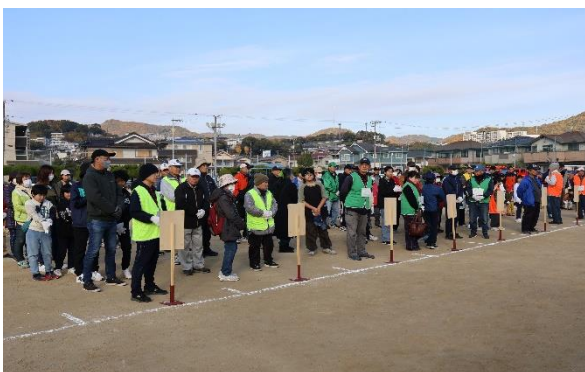
【 開会式 】

11月23日（日）樹徳小学校運動場で自主防災訓練を行いました。 内容としては、4班に分かれて、AED 操作訓練・負傷者搬送訓練・ロープの結び方・水防訓練（土のう作り、土のう積み）・水消火器を体験。 今年度初めて避難場所体験訓練（校舎南棟3階まで）を行いました。 自然災害は、いつどこで起こるかわかりません。様々な訓練を体験し繰り返して行うことによって災害意識を高め、災害時における自助・共助の重要性を確認し、今後起こりうる災害に備えましょう。