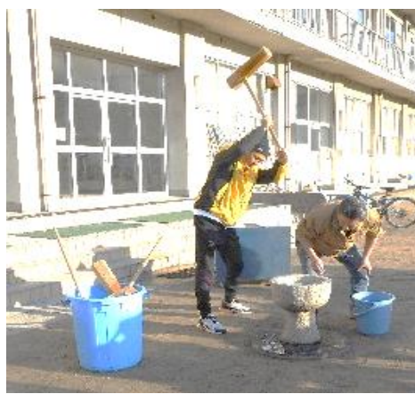
昨 年 の と ん ど ま つ り で す