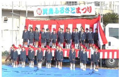
【小学生の音楽発表】

11月16日、第36回箕島ふるさとまつりが開催されました。学区の皆さまのご協力と、多くの方々の参加で、大盛況のうち無事終えることができました。また、開催にあたりご尽力いただいた関係者・地域の皆さまに改めて感謝申し上げます。