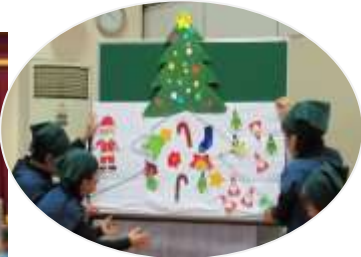
クリスマスツリーに飾りつけもしたよ！