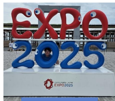
思い出の大阪万博

福山で暮らして、ここの住民たちと交流したことによって、隣国の社会を観光客の立場から少し離れて新しい目線から眺め、私の故郷をどうやってもっと美しい町にできるかと振り返るきっかけになりました。福山市役所の1人として勤務した間は、人生に二度とない素晴らしい経験でした。この1年間大変お世話になりました。ここでの思い出は絶対に忘れません。次は韓国でお目にかかれることを楽しみにしております。美味しい料理と素敵な場所をご案内させていただきます。