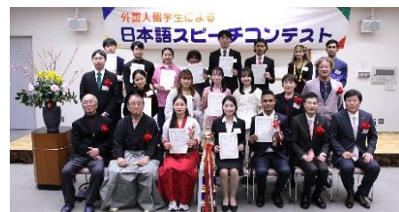
第 32 回の様子

【問合せ先】 外国人留学生を支援する会事務局（アイデアル株式会社内） TEL（084）961-3339（代表）