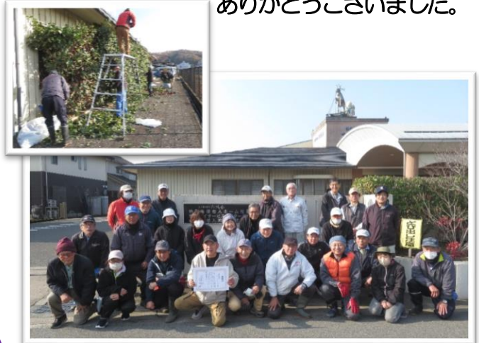
駅家西学区ボランティアの会