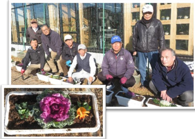
主催 駅家西学区まちづくり推進委員会 生活環境部会

12月9日(火) 生活環境部会員の皆さんが、寒い中、色とりどりの葉牡丹・パンジー・ヒオウの寄せ植えを作りました。出来上がった寄せ植えは、利用される地域の皆さんに和んでいただけるよう、各町内会・自治会の集会所に持ち帰りました。