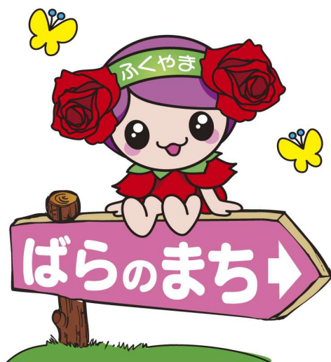
ばらのまち福山 イメージキャラクター「ローラ」

改訂／2025年度（令和7年度）9月 福山市 保健福祉局 長寿社会応援部 高齢者支援課