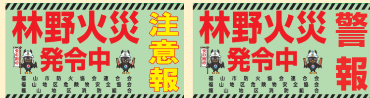
発令時車両に貼るシート