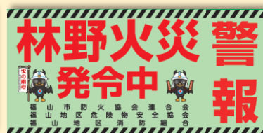
発令時車両に貼るシート