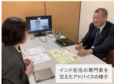
インド在住の専門家を交えたアドバイスの様子

一社一社のご相談を担当する専門家陣のほか、国内・海外に200名超の登録専門家が法務・税務・規制・現地マーケティング等の課題を掘り下げ、海外展開の実現に向けた最適策をナビゲートします。