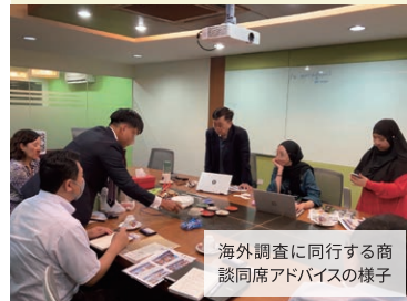
海外調査に同行する商談同席アドバイスの様子

ご相談の中で組み立てた海外展開の姿がビジネスとして成り立つか、現地調査に同行し、現地でもアドバイスすることで海外事業計画を仕上げます。