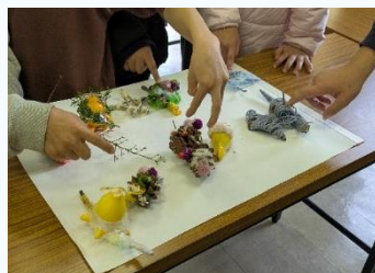
思い思いに制作しました