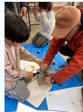
のこぎり難しいぞ!?