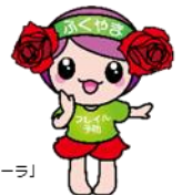
「フレイル予防ローラ」