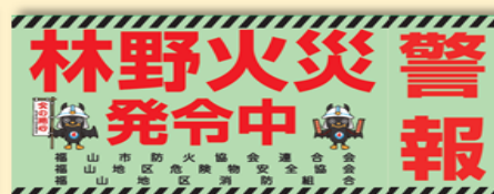
発令時車両に貼るシート