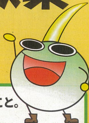
福山市環境イメージキャラクター 「くわいちゃん」

高齢社会が進むにつれ、自力ではごみ出しができないという状況が全国で問題となっています。いつまでも安心して生活ができるよう「ごみ出しのバリアフリー」に向けて、戸別収集を行います。