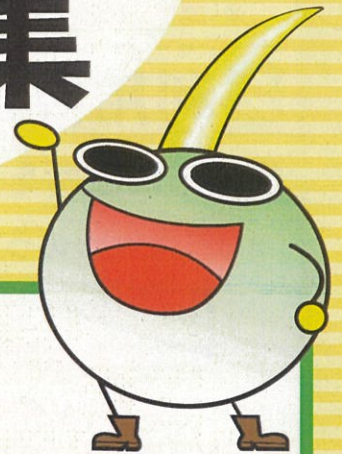
福山市環境イメージキャラクター 「くわいちゃん」

みなさまが支援されている人の中に、ごみ出しで困っている人はいらっしゃいませんか。